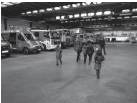
foto: de ziekenwagen